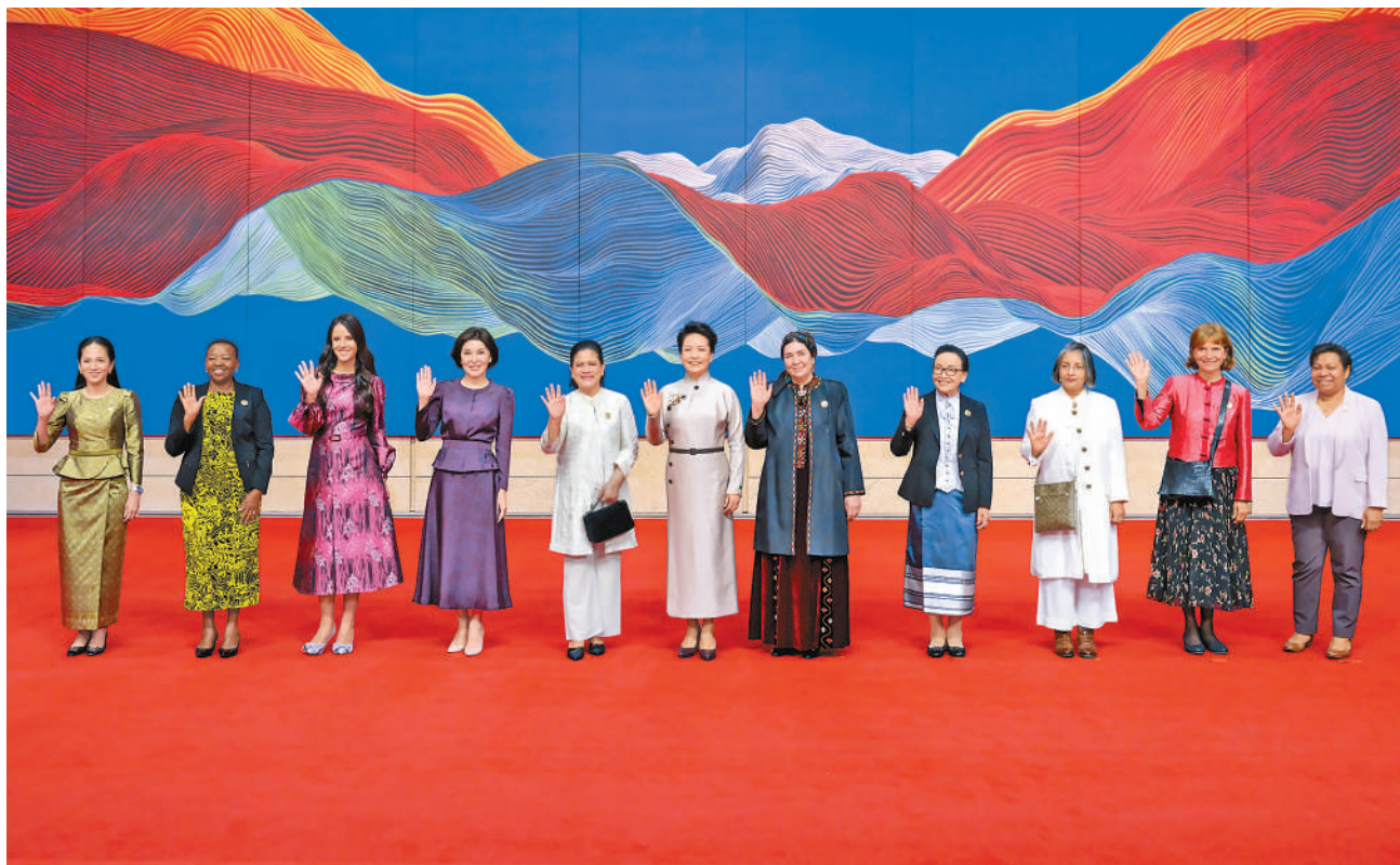
10月18日上午，国家主席习近平夫人彭丽媛邀请出席第三届“一带一路”国际合作高峰论坛的外方领导人夫人参观中国工艺美术馆(中国非物质文化遗产馆)。这是彭丽媛同外方领导人夫人在中国工艺美术馆中央大厅内合影留念。