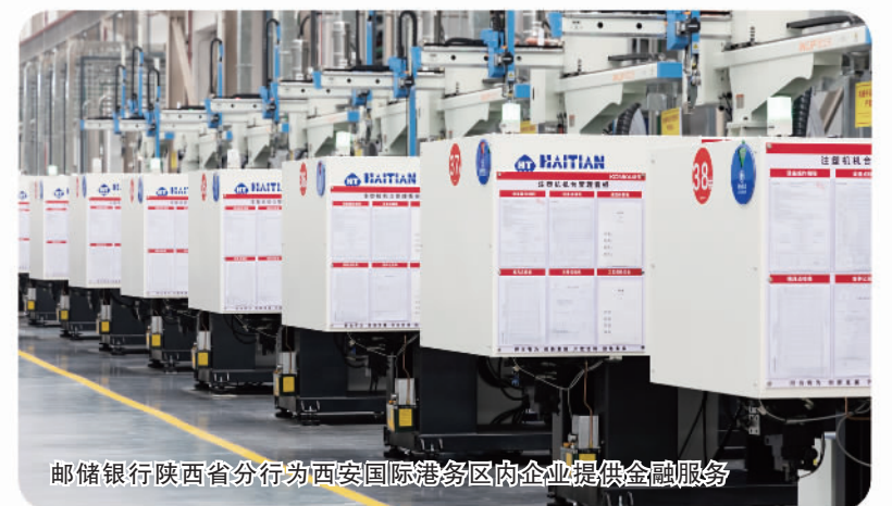
邮储银行陕西省分行为西安国际港务区内企业提供金融服务

中国邮政储蓄银行陕西省分行积极落实国家战略,围绕陕西省推进“一带一路”建设工作要点和《陕西省“十四五”深度融入共建“一带一路”大格局,建设内陆开放高地规划》,聚焦“五大中心”建设,强化总体设计,加强组织领导,整合各类要素和优势资源,全力以金融画笔助力陕西绘就深度融入共建“一带一路”的壮美画卷。