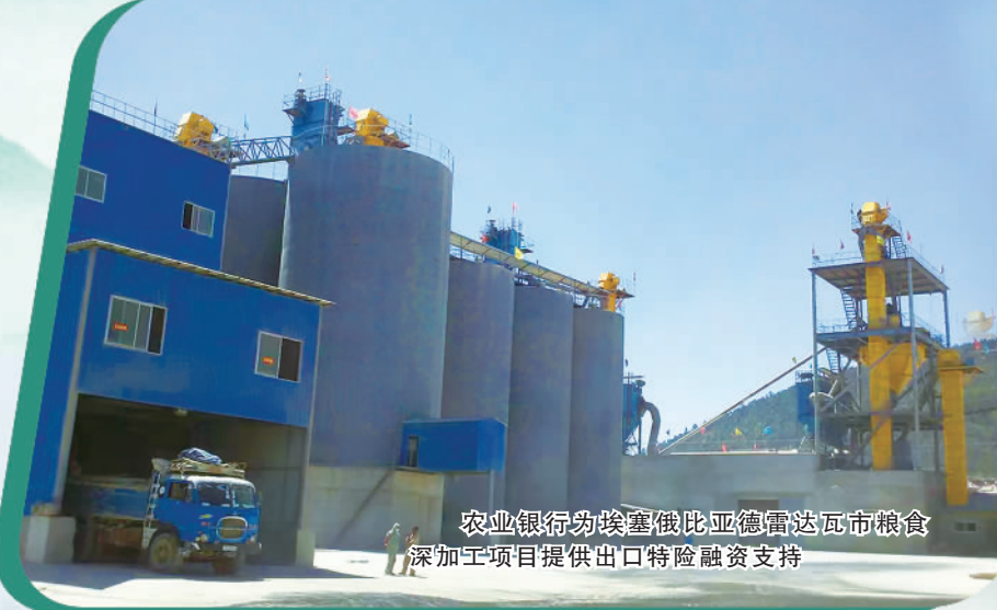
农业银行为埃塞俄比亚德雷达瓦市粮食深加工项目提供出口特险融资支持