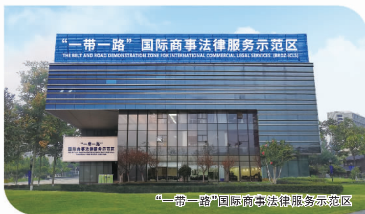
“一带一路”国际商事法律服务示范区

坚持对表对标,积极承接重大任务,服务国家开放大局有力有效。 与哈萨克斯坦、吉尔吉斯斯坦、乌兹别克斯坦等国家的省州建立友好省州关系,中国—中亚峰会在陕西省西安市举办,主办中国—中亚民间友好论坛等重大活动。持续放大中国—中亚峰会效应,17项涉