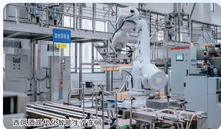
西凤酒现代化智能生产车间