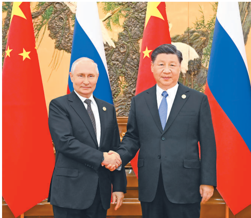
10月18日中午,国家主席习近平在北京人民大会堂同来华出席第三届“一带一路”国际合作高峰论坛的俄罗斯总统普京举行会谈。

习近平指出,不久前,金砖国家实现历史性扩员,展现了发展中国家推动世界多极化、国际关系民主化的信心。