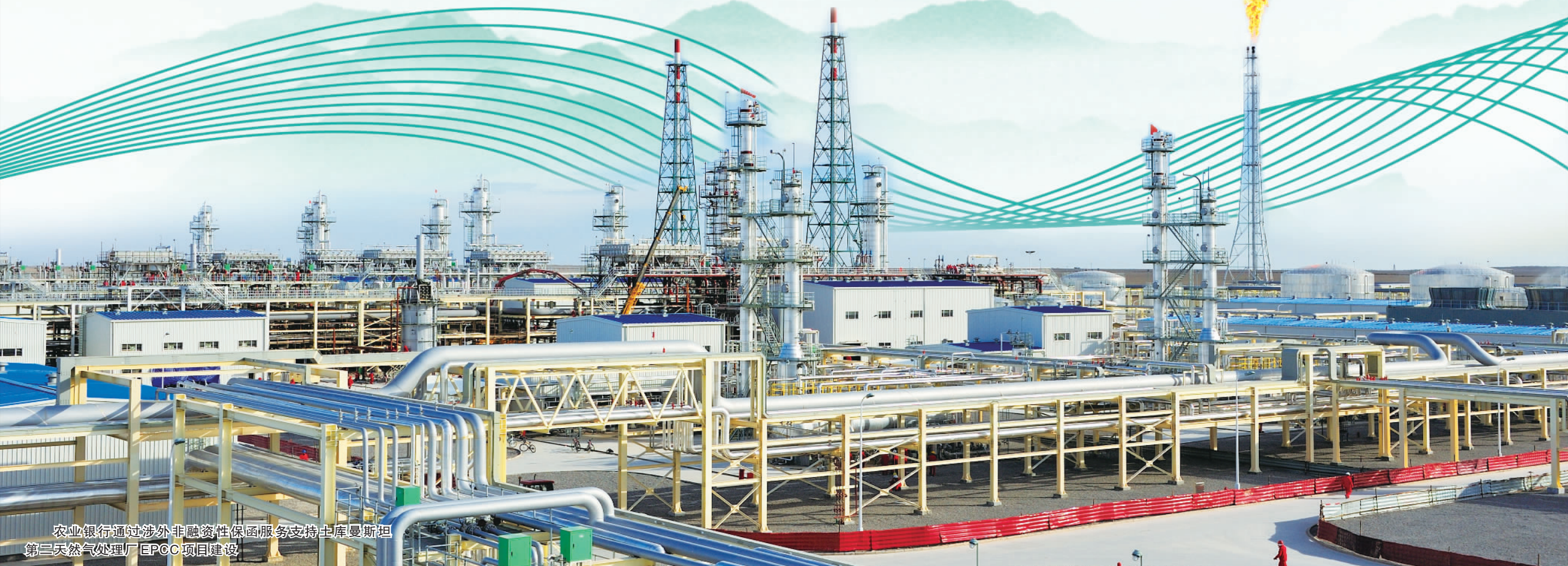
农业银行通过涉外非融资性保函服务支持土库曼斯坦第三天然气处理厂EPC项目建设