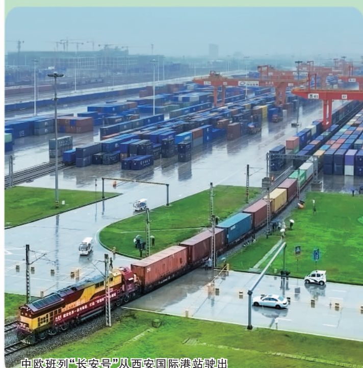
中欧班列“长安号”从西安国际港站驶出

中国邮政储蓄银行陕西省分行积极落实国家战略,围绕陕西省推进“一带一路”建设工作要点和《陕西省“十四五”深度融入共建“一带一路”大格局,建设内陆开放高地规划》,聚焦“五大中心”建设,强化总体设计,加强组织领导,整合各类要素和优势资源,全力以金融画笔助力陕西绘就深度融入共建“一带一路”的壮美画卷。