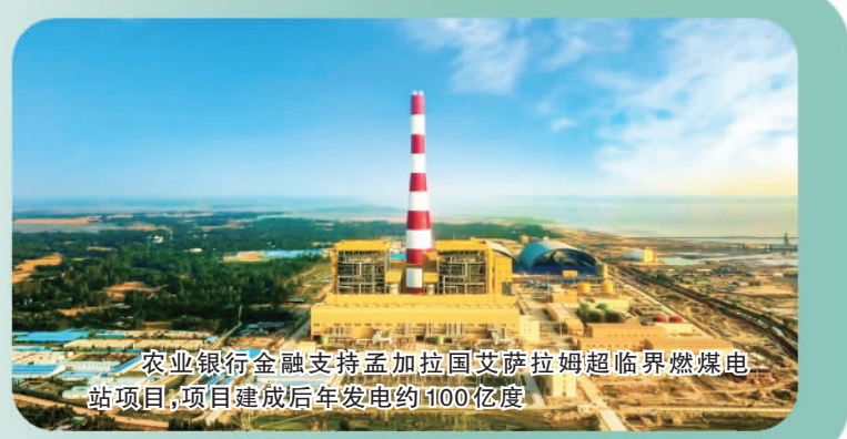
农业银行金融支持孟加拉国艾萨拉姆超临界燃煤电站项目,项目建成后年发电约1100亿度

2023年是共建“一带一路”倡议提出十周年。十年来,农业银行坚持服务共建“一带一路”倡议,持续创新产品服务体系,加快人民币国际化推广应用,积极为“一带一路”建设注入金融动力,累计为共建“一带一路”国家相关项目、贸易融资、中资企业设备出口等提供信用支持超过1万亿美元。