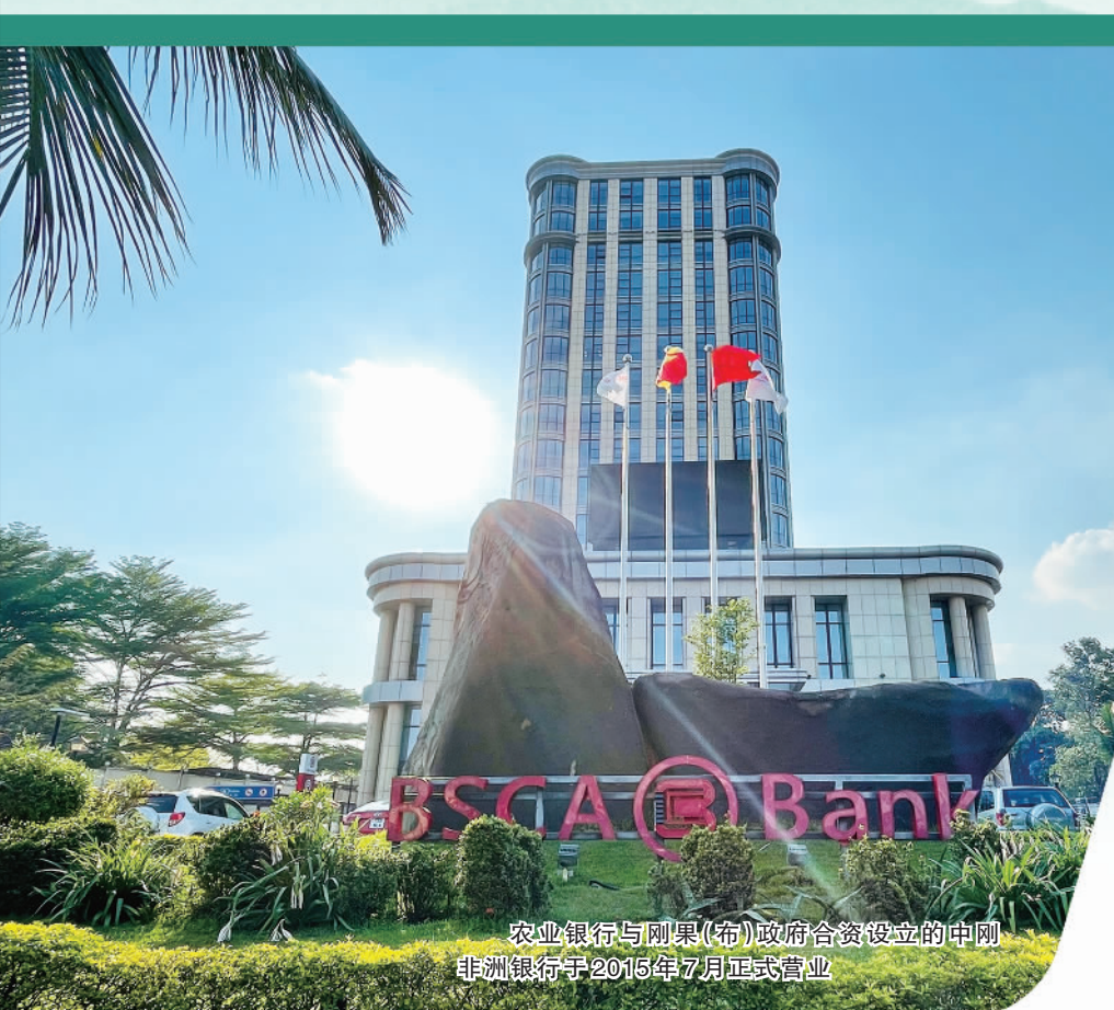
农业银行与刚果(布)政府合资设立的中刚非洲银行于2015年7月正式开业