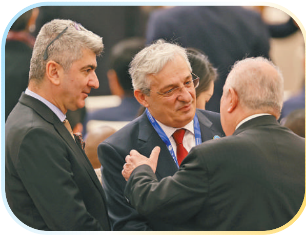
左图：第三届“一带一路”国际合作高峰论坛开幕式现场。

(本报记者 车斌、赵益普、万宇、龚鸣、王新萍、刘仲华、黄培昭、王海林、宋亦然、李强、孙广勇、陈一鸣、李欣怡)