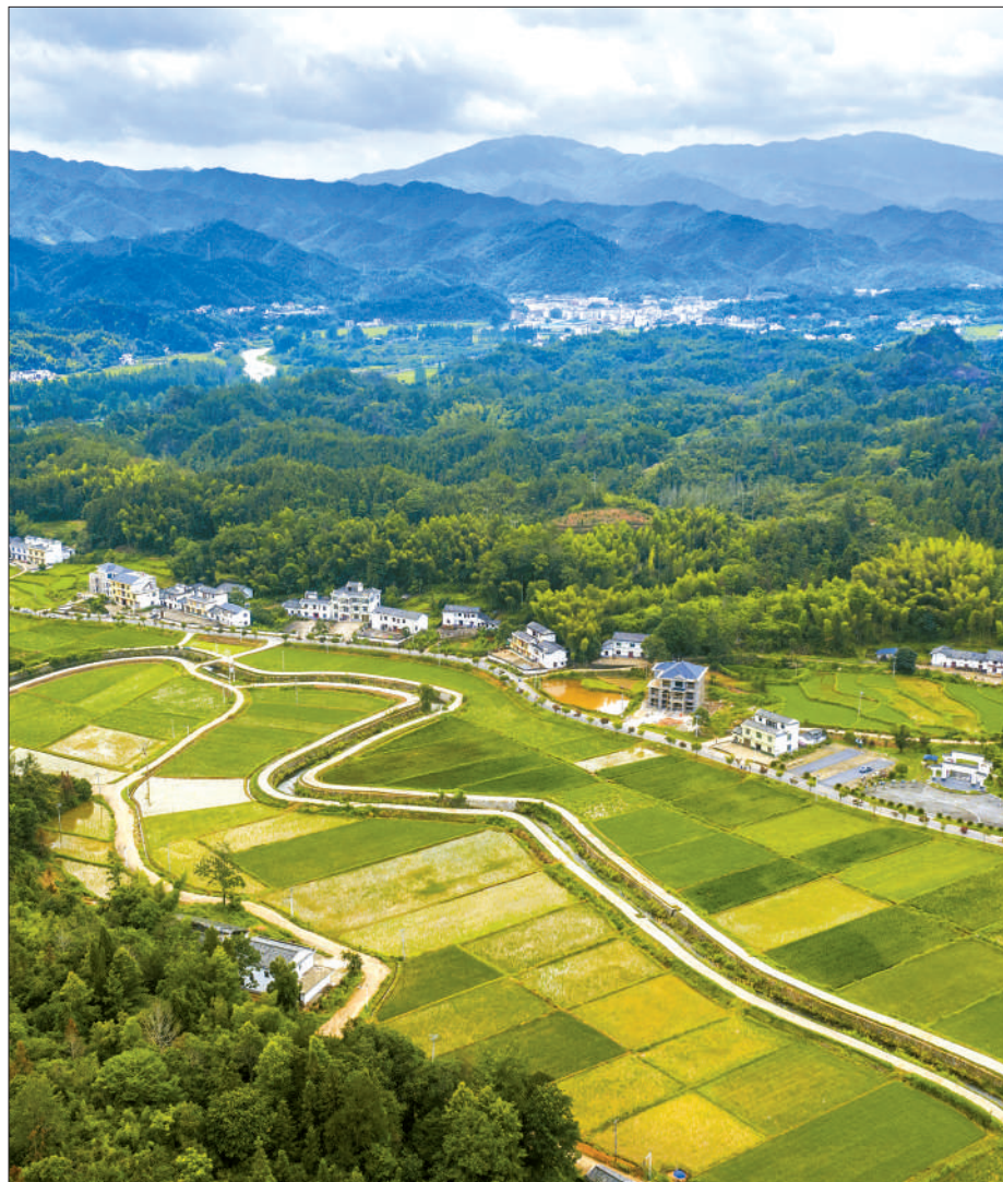
江西省宜春市铜鼓县三都镇东山村，受益于当地的高效节水灌溉工程等项目，农业节水灌溉综合水平不断提升。

能源保障和安全是“国之大者”。“十四五”时期是碳达峰的关键期、窗口期，能源发展转型任务更加紧迫。开发利用好地热能这份不可多得的宝贵资源，积极建设多元清洁的能源供应体系，我们一定能把能源的饭碗牢牢端在自己手里，在生产发展、生活富裕、生态良好的文明发展道路上不断取得新的更大成绩。