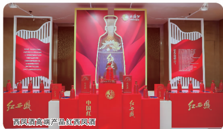
西凤酒高端产品红西凤酒

的坚守。从传统中汲取智慧，以科技推动发展。西凤集团正顺势而上，以高质量发展为目标，“振翅”飞出三秦、飞向世界。