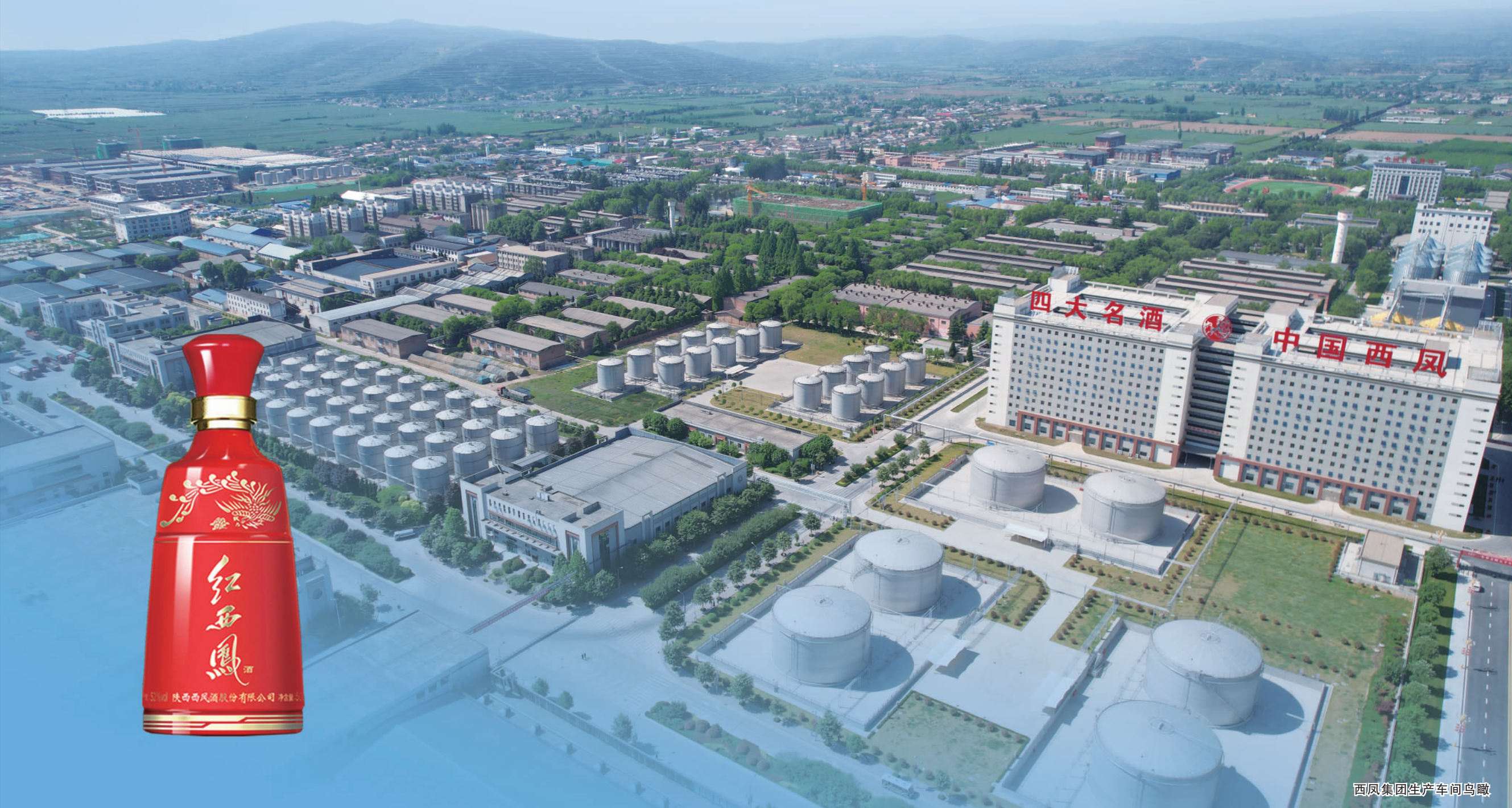
西凤集团生产车间鸟瞰