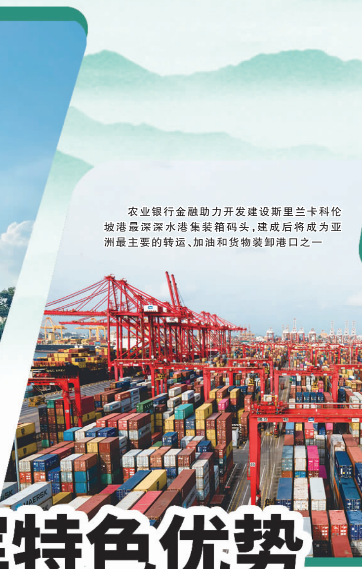
农业银行金融助力开发建设斯里兰卡科伦坡港最深深水港集装箱码头,建成后将成为亚洲最主要的转运、加油和货物装卸港口之一