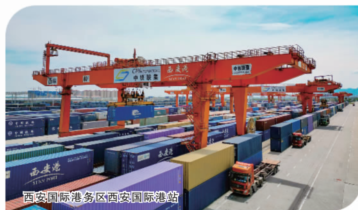
西安国际港务区西安国际港站

发挥科教优势,强化智力人才支撑,科技教育中心建设拓点扩面。 依托省内各类科技创新主体,深度参与“一带一路”科技创新行动计划,有效对接和利用全球科技创新资源,着力推进科技人文交流、共建联合实验室、科技园区合作、技术转移四项行动,与43个国家和地区建立了全方位合作关系,建立了23个国家级、124个省级国际科技交流合作基地,已建和在建国际科技合作项目350余个,近三年与共建“一带一路”国家技术合同成交79项,金额17.38亿元。十年来,持续推进高校特色联盟发展,先后成立丝绸之路大学联盟、“一带一路”职教联盟、“一带一路”文化遗产国际合作联盟等,对推进丝绸之路教育共同体建设发挥了重要作用;大力支持中外合作办学,全省中外合作办学机构与项目46个;推进非通用语种专业和复语教育,推广校企联合、订单式、学术导向的来华留学人才培养模式,大力