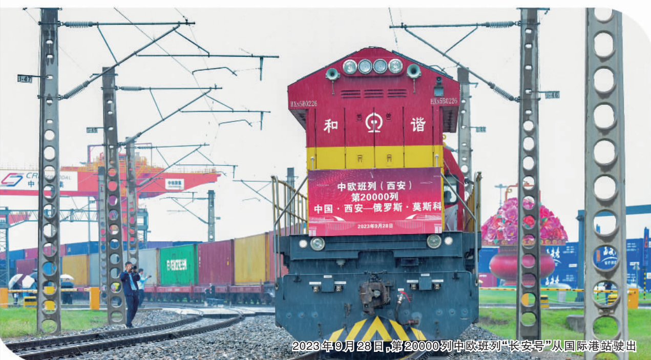
2023年9月28日,第20000列中欧班列“长安号”从国际港站驶出