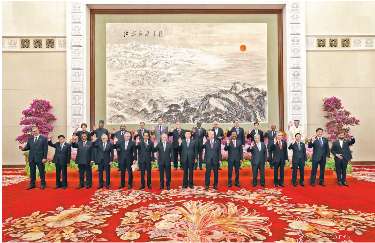
10月18日上午,国家主席习近平在北京人民大会堂出席第三届“一带一路”国际合作高峰论坛开幕式并发表题为《建设开放包容、互联互通、共同发展的世界》的主旨演讲。这是会前,习近平同出席高峰论坛的外国国家元首、政府首脑和国际组织负责人等国际贵宾集体合影。