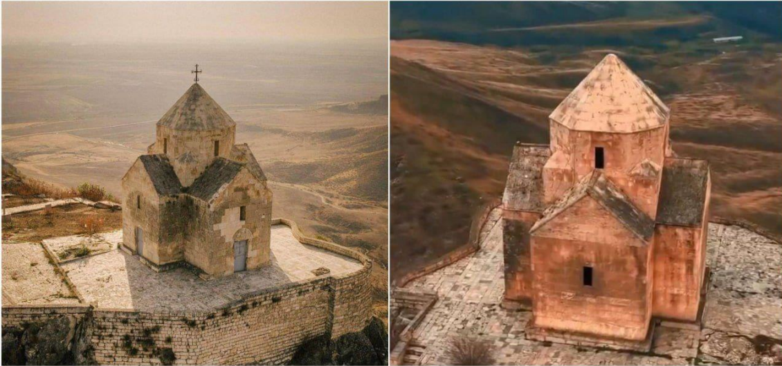
Фото церкви в Нагорном Карабахе со снятым крестом

Продолжились обвинения в сторону Азербайджана в уничтожении культурного наследия Нагорного Карабаха. Так, широкое обсуждение в соцсетях получила новость о том, что с расположенной в Ванкасапе церкви азербайджанскими военными был снят крест.