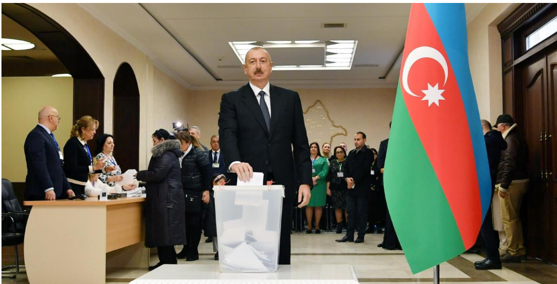
Ильхам Алиев на избирательном участке в Нагорном Карабахе

Самым резонансным инфоповодом этой недели стали внеочередные выборы президента Азербайджана, на которых с огромным преимуществом (92% по предварительным данным при явке в 77% избирателей) победил действующий глава государства Ильхам Алиев . Остальные кандидаты не смогли набрать более 2% голосов избирателей. Значительное возмущение армянских СМИ и соцсетей вызвал тот факт, что сам Алиев проголосовал не по месту прописки в Баку, а в столице Нагорного Карабаха – городе Ханкенди (Степанакерте) . Независимые наблюдатели заявили о многочисленных нарушениях в ходе голосования. Так, часть наблюдателей удаляли с участков под различными предлогами. Большое удивление армянских СМИ вызвала статистика по голосованию в Нагорном Карабахе – там была зарегистрирована крайне высокая явка избирателей, что дало повод говорить о возможной фальсификации результатов голосования. Также армянские блогеры обвиняли российских политиков и журналистов в лояльном отношении к выборам.